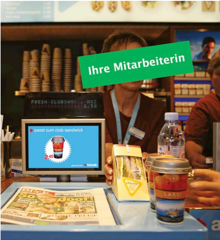
Dynamic Instore Merchandising by screenFOOD® CS 3.x