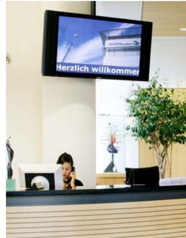
screenFOOD® im Einsatz bei Electrosuisse AG in Fehraltorf

screenFOOD® Standalone ist eine einfach zu verwendende Software zur Verwaltung von Medien für digitale Anzeigesysteme.