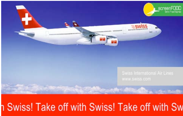
Ihre Präsentation auf dem Bildschirm...